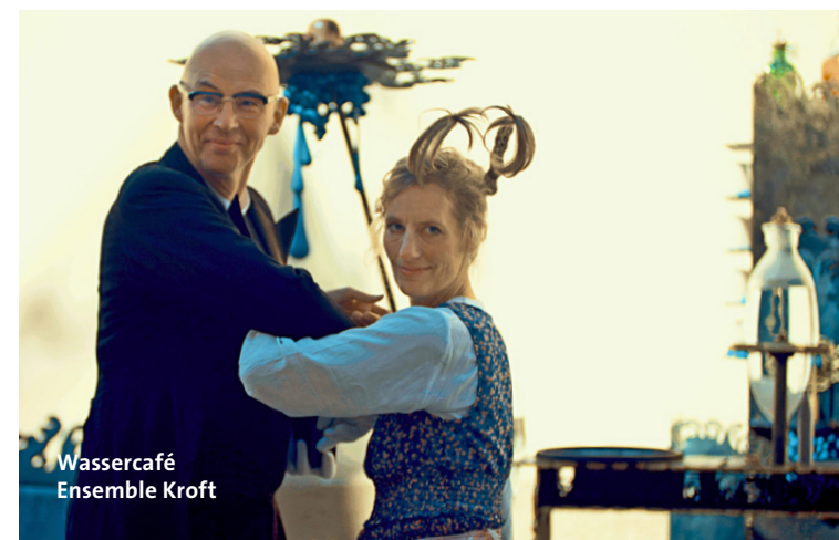
Wassercafé Ensemble Kroft