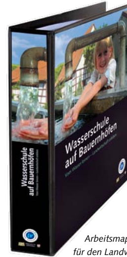
Arbeitsmappe für den Landwirt

Im Mittelpunkt der Hofbesuche stehen praktische Erfahrungen und Erlebnisse, welche die Kinder mit allen Sinnen wahrnehmen. Wasserrallye, Exkursionen, Experimente und Spiele sorgen für Neugierde und Motivation und garantieren Spaß und Spannung. Gleichzeitig lernen die Kinder die Bedeutung von Wasser für das Leben und seine vielfältigen Formen in der Landwirtschaft kennen.